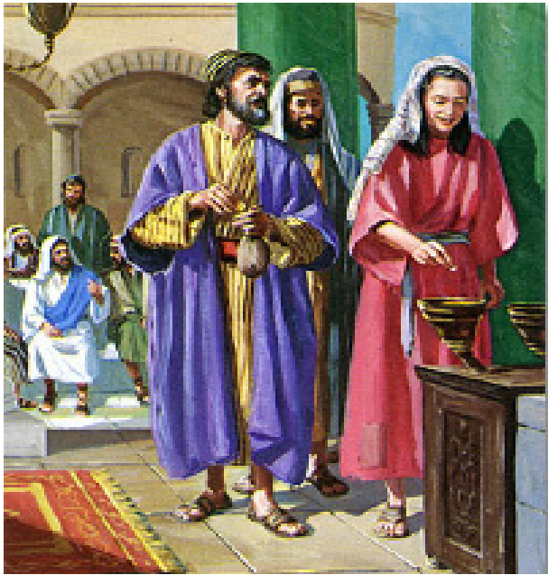
THE WIDOW'S OFFERING

XXXII Sunday in Ordinary Time November 10-11, 2012