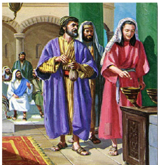
La ofrenda de la Viuda